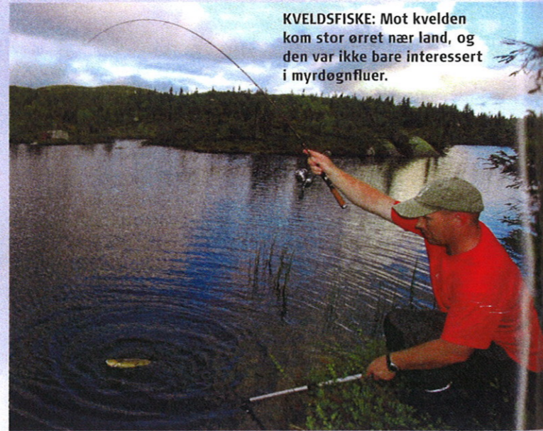
KVELDSFISKE: Mot kvelden kom stor ørret nær land, og den var ikke bare interessert i myrdøgnfluer.

Neste dag var grå, men mye varmere, mye på grunn av at vinden nesten hadde stilnet. Kun en mild bris strøk vannflata. Det viste insektene å sette