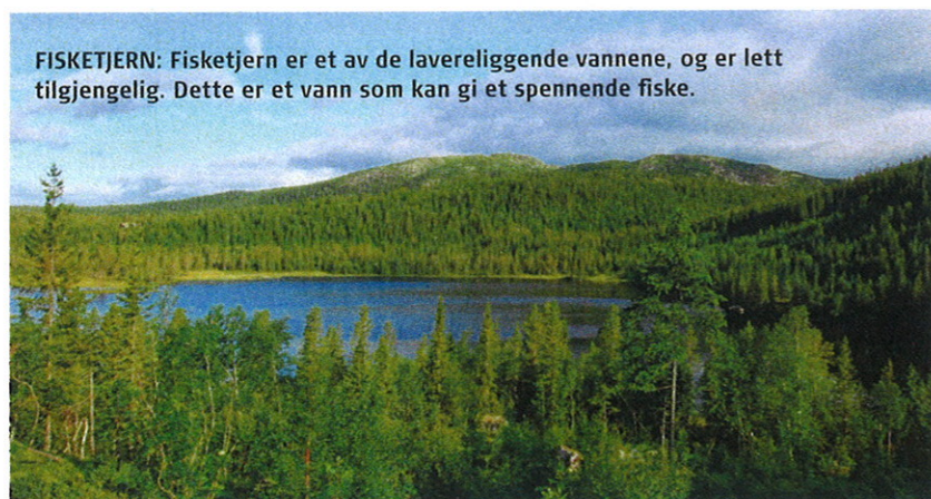
FISKETJERN: Fisketjern er et av de lavereliggende vannene, og er lett tilgjengelig. Dette er et vann som kan gi et spennende fiske.

K nallfiske og feite ørretkubber kan enkelte ganger være et resultat av ren slump. En dag jeg surfet på nettet dukket en turblogg opp. En av turene omhandlet Vikerfjell, et fjellområde kun ti mil fra Oslo. På et av bildene blinket deler av et vann i bakkant som så veldig spennende ut. Men hvilket vann var det, og var det fisk der? Dermed var detektivarbeidet i gang.