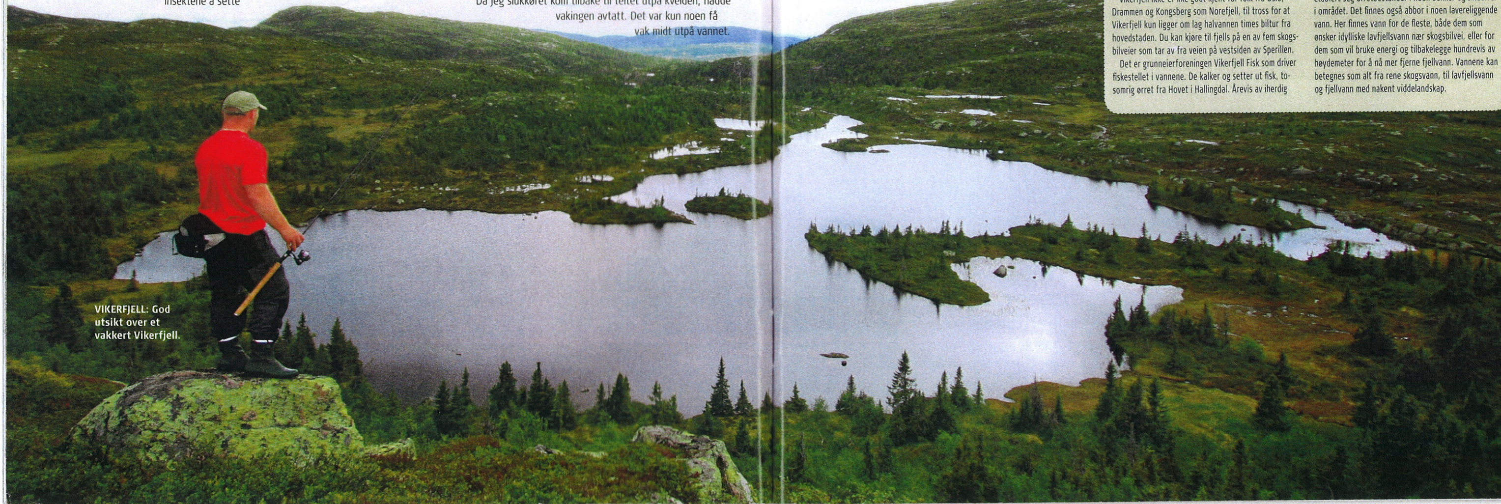
VIKERFJELL: God utsikt over et vakkert Vikerfjell.

kultivering har gitt resultater. I dag finnes et tjuetall vann med en meget god ørretbestand. I tillegg har det etablert seg ørretbestander i noen bekker og småelver i området. Det finnes også abbor i noen lavereliggende vann. Her finnes vann for de fleste, både dem som ønsker idylliske lavfjellsvann nær skogsbilvei, eller for dem som vil bruke energi og tilbakelegge hundrevis av høydemeter for å nå mer fjerne fjellvann. Vannene kan betegnes som alt fra rene skogsvann, til lavfjellsvann og fjellvann med nakent viddelandskap.